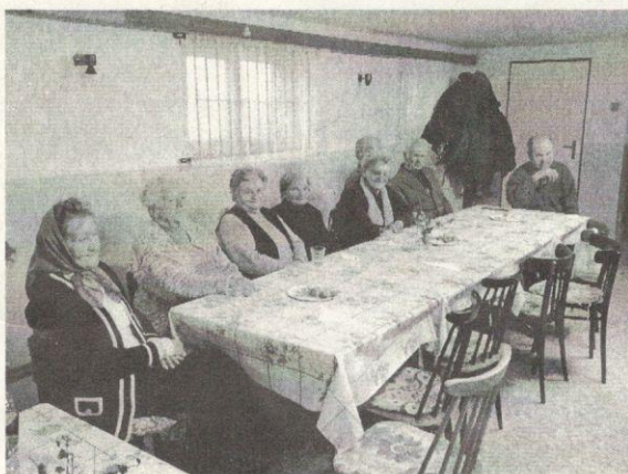
Dňa 22.2.2008 sa konala výročná členská schôdza Jednoty dôchodcov.