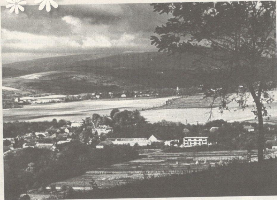
Foto z roku 1972, pohľad z Hája

Radosť jari svetom letí, teší starých, mladých, detí. A na briežku u potôčka, kýva deťom snežienočka.