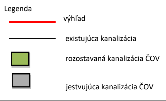
Schéma odvádzania a čistenia odpadových vôd v okrese Ilava, Púchov a Považská Bystrica