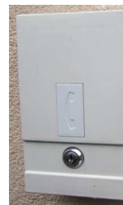
Ilustračná fotografia optickej skrinky