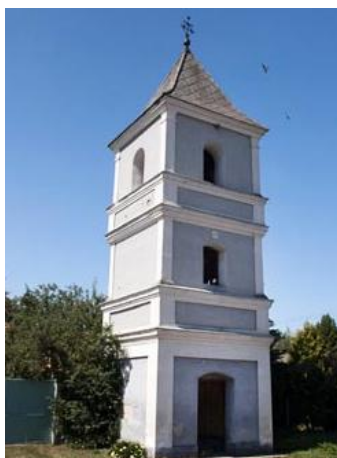
Obr.č.2 Neoklasicistická zvonica