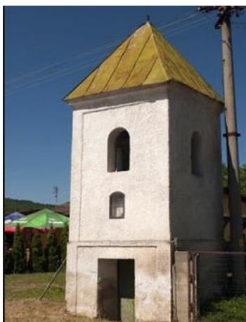
Obr.č. 1 Baroková zvonica